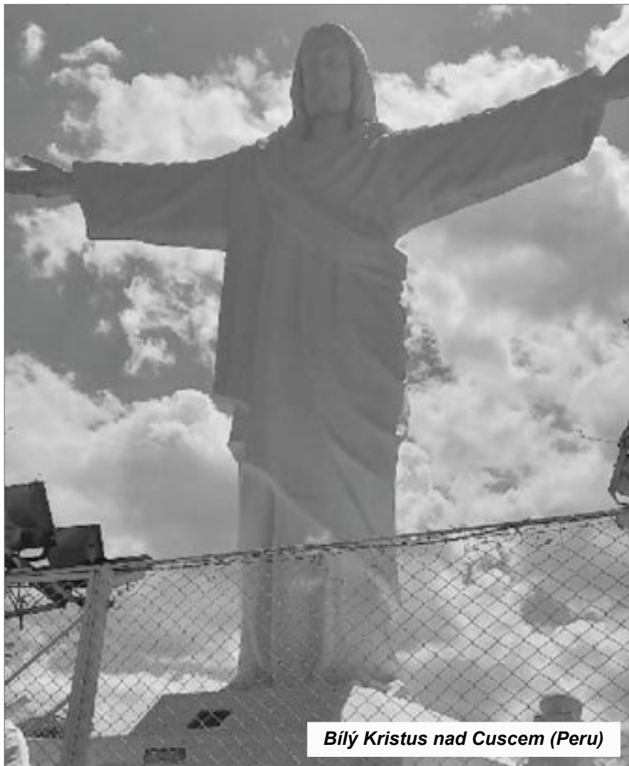
Bílý Kristus nad Cuscem (Peru)