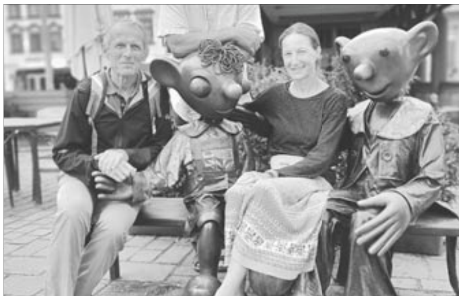
Plzeň – cyklopout'