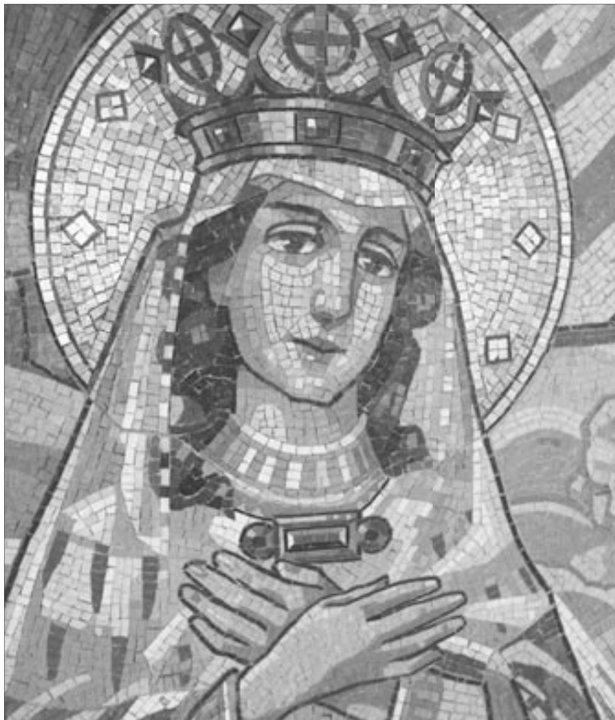
Panna Maria, detail oltární mozaiky