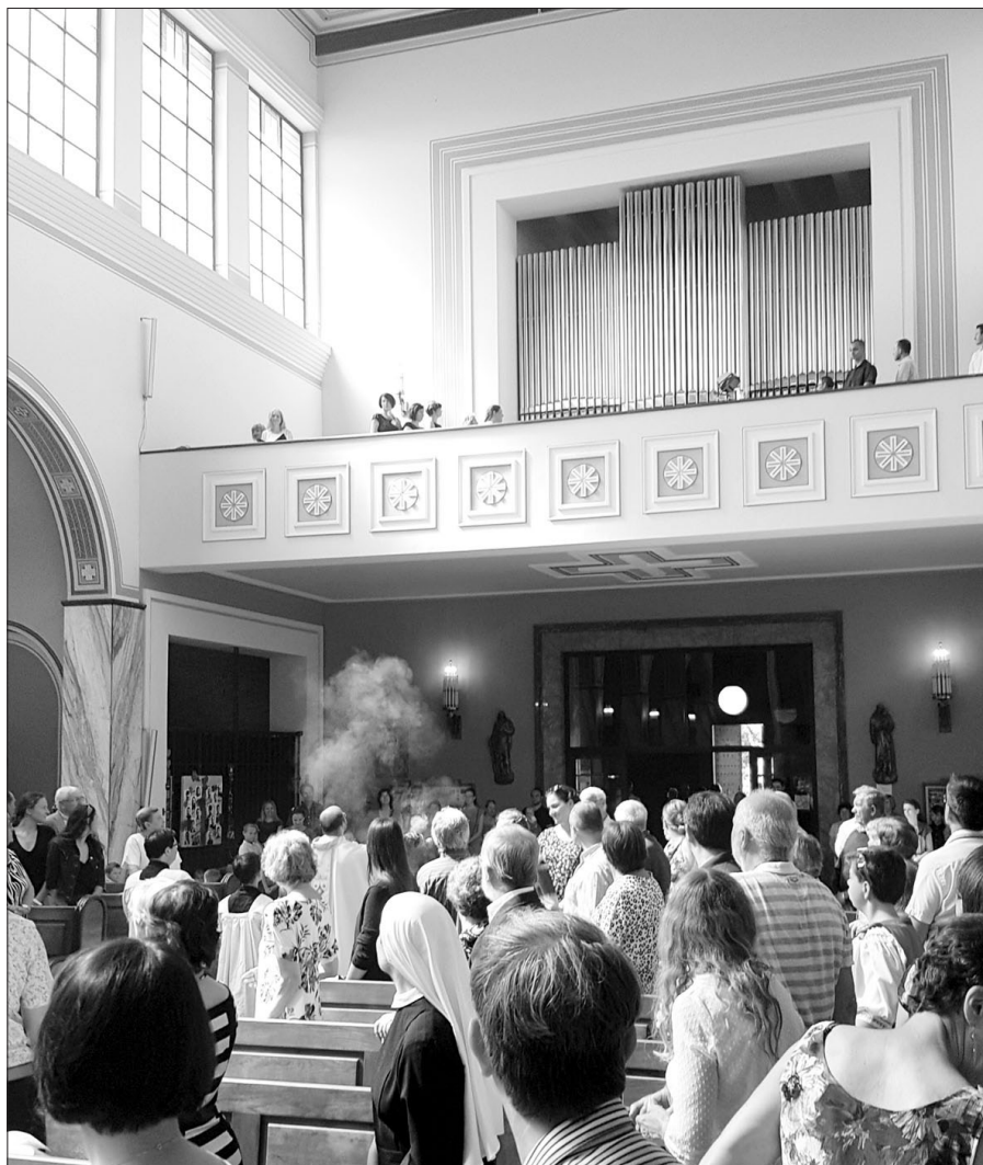
Žehnání hejčínských varhan 5. 7. 2020