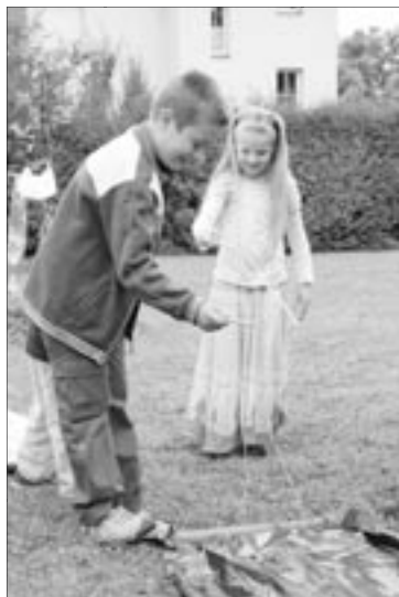
... rybolov ...