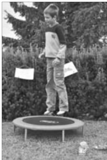
... trampolína ...