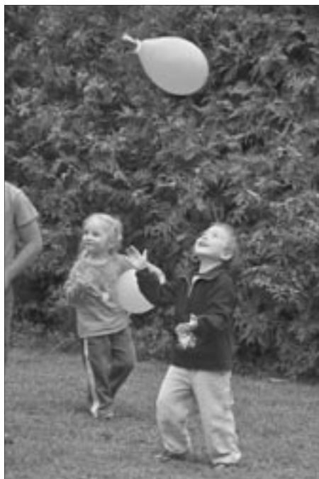
... balónky ...