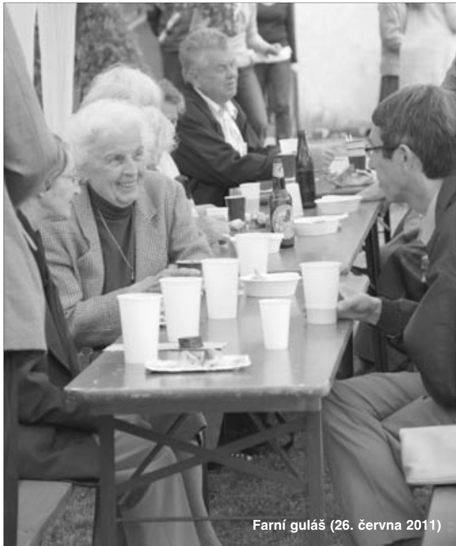
Farní guláš (26. června 2011)